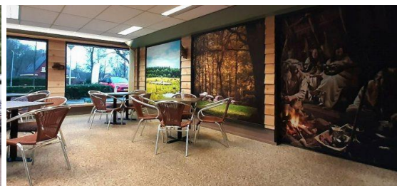
Ontvangstruimte Eko-Tours, Valtherweg 1 – Exloo

Namens Stichting Waar een Wil is: Tot 17 oktober 2022